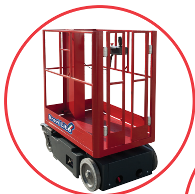
Kompaktowy i mocny