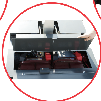
Wbudowane kieszenie na wydły